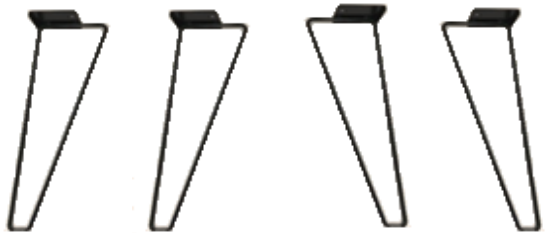
脚 Lレッグ・Rレッグ×各2本