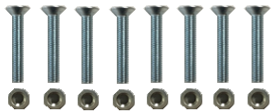
ビス・ロックナット×8本